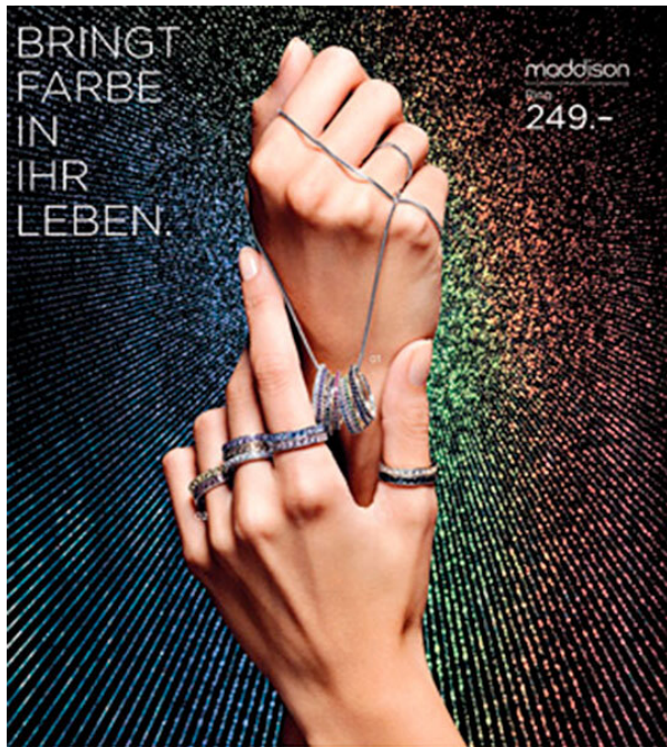
MADDISON: 01 RING Weiss-/Gelbgold, 18 Karat, mit synth. Zirkonas, diverse Farben, je 249.- (ohne Kette) | 02 RING Weiss-/Gelbgold, 18 Karat, mit synth. Zirkonas, diverse Farben, je 299.- MANOR 29