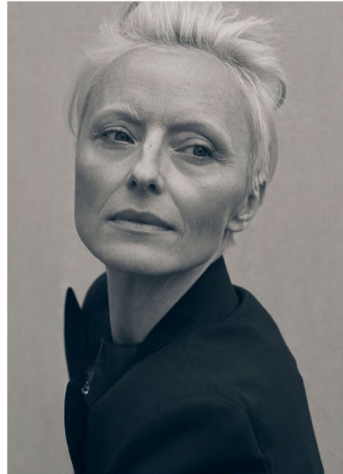
Blazer: Paul Smith @paulsmithdesign, Leo Top: Dawid Tomaszewski @dawidtomaszewski