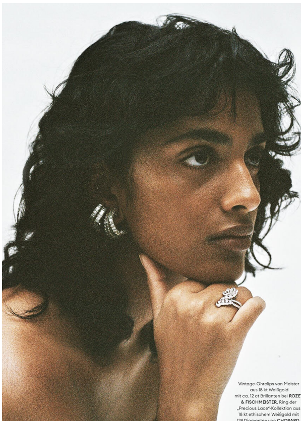
Vintage-Ohrclips von Meister aus 18 kt Weißgold mit ca. 12 ct Brillanten bei ROZET & FISCHMEISTER, Ring der „Precious Lace“-Kollektion aus 18 kt ethischem Weißgold mit 128 Diamanten von CHOPARD.